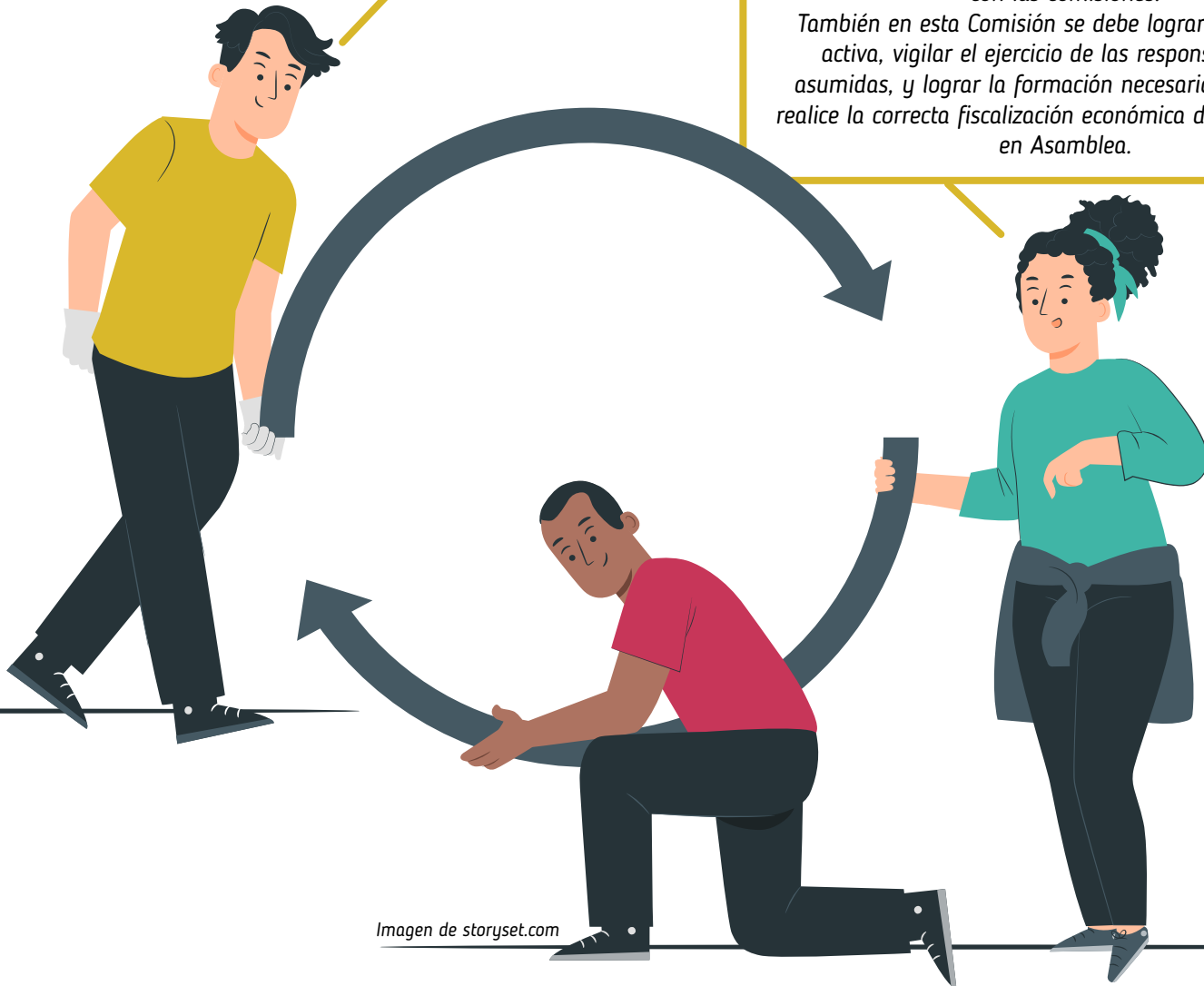
Imagen de storyset.com

También en esta Comisión se debe lograr una escucha activa, vigilar el ejercicio de las responsabilidades asumidas, y lograr la formación necesaria para que se realice la correcta fiscalización económica de lo planificado en Asamblea.